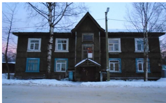
Дом на улице Артемьева